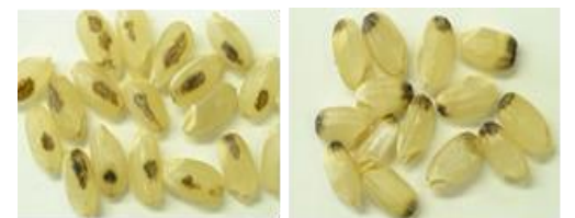
カメムシ類による斑点米

草刈り運動期間 : 6月28日(金)~7月7日(日) 県下一斉草刈り日 : 6月29日(土)~6月30日(日)