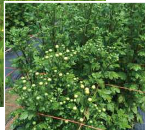
小菊は暑さには強いが、暑すぎるとなかなか花が開かないので管理が重要