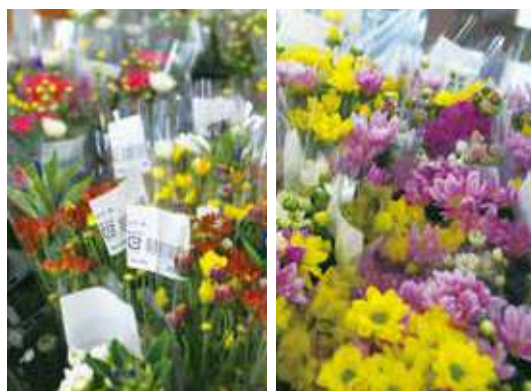
7月盆向けにあぐりっち店頭に並んだ切り花

私は母がやっていた野菜・花卉栽培を手伝う形で始めました。JA高岡の職員さんから「ストックを育ててみませんか」という話があり、ためにストックを栽培してみたところとてもよい出来で、そこから花卉栽培に夢中になっています。メインとなる菊栽培は手間はかかりますが、一株から3~4本とれるので、品質の良い花を栽培できれば多くの収穫を見込めるのが魅力です。