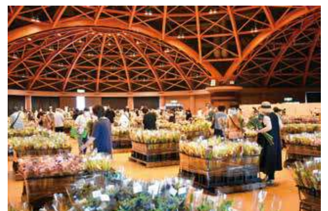
昨年度のお盆切り花大特売市 [高岡テクノドーム]