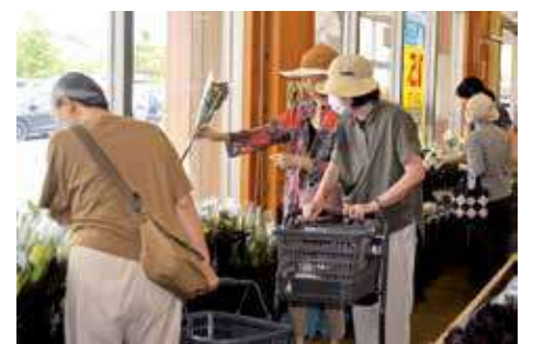
7月中旬の切り花販売は大盛況

最近はおお客様の目も肥えてきて品質のよい切り花でなければ売れません。でも、ちゃんとした品質の切り花を出荷すれば必ず購入していただけます。部会員の丹精込めて栽培した切り花が今年もたくさんのお客様と出会うことを願っています。