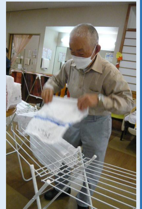
いつも家でやってるから任せて!!