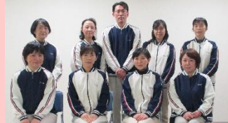
小規模多機能型居宅介護