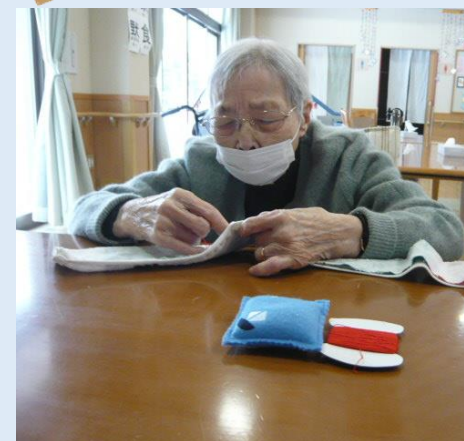
若いころから裁縫してたよ!