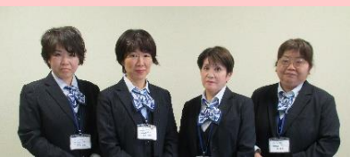
居宅介護支援センター