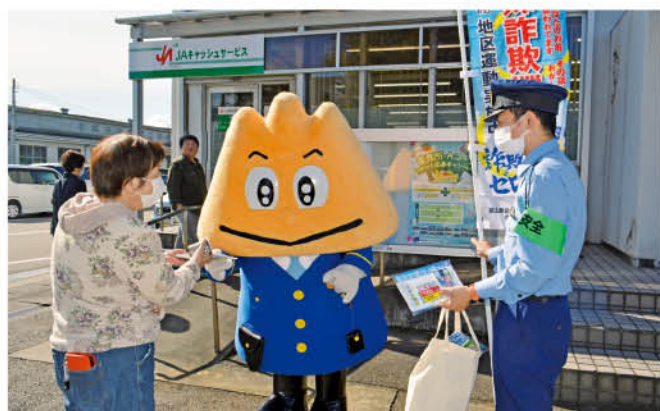
富山県警察シンボルマスコット「立山くん」も一緒に呼びかけ

年金受給日の10月13日(金)高岡警察署員は佐野支店とあぐりっち佐野店で、利用者に特殊詐欺被害防止を呼びかけるチラシを手渡しました。高岡署管内で発生した特殊詐欺被害件数と被害額は、昨年は5件で約1,069万円だったのに対し、今年度は10月12日(木)現在11件で約6,610万円になっていて、特に架空請求詐欺や還付金詐欺が多く発生しています。