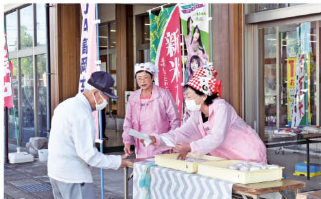
ご飯を食べて毎日元気に過ごしましょう！

富山県JA女性組織協議会では「ごはんを食べよう運動」を各JA女性部で展開しています。生活様式が多様化し、米の消費量が年々減少している中で、お米をもっと食べてもらうのはもちろんのこと、ご飯を主食とした四季折々の豊かな食文化の大切さを発信しています。9月末から各JAの直売所などでおにぎりや新米、パックごはんを配りました。