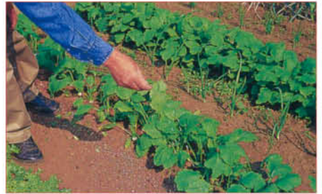
3 となりの株と葉が重なり合わないくらいの間隔を与える