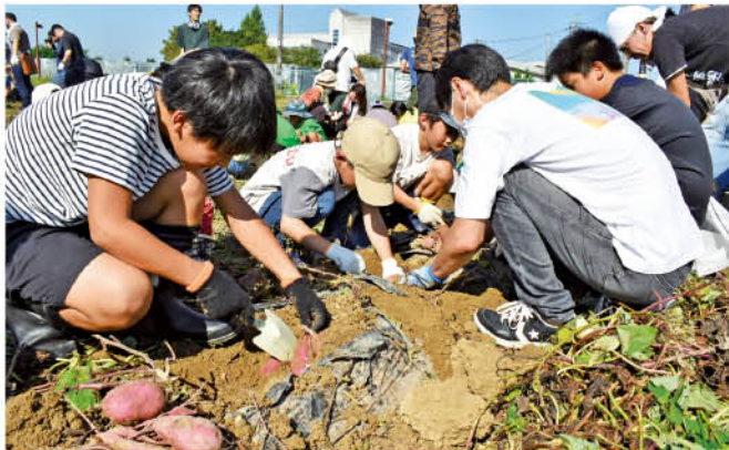
手やシャベルを使って丁寧に掘り起こします