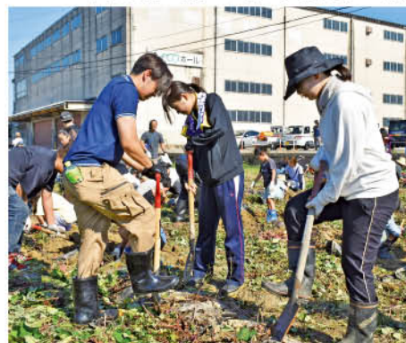
子どもたちが掘りやすいように新入職員がおてつだい

収穫したサツマイモは参加者がお土産として持ち帰ったほか、市内の児童福祉施設やこども食堂に贈呈されました。