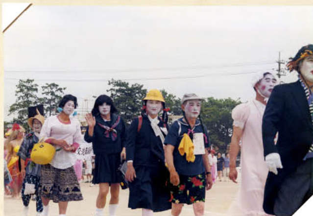
「結婚から金婚式を迎えるまで」を表現した仮装行列