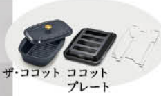
ザ・ココット ココットプレート

RHS71W31E13RCASTW 希望小売価格 384,340円 (税込) ※標準幅60cmタイプもあります