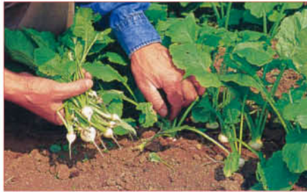
2 間引くときは残す株を傷めないようそっと抜く