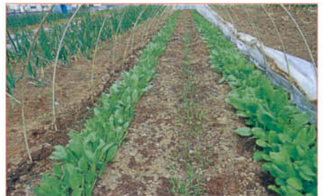
1 ホウレンソウの、1回めの間引き後、さらに生長して間引きが必要な株

間引きは何度かに分けて行う。1回めは、子葉が開ききって葉が密集したところに行く。2回めは本葉が2～3枚のころ。その後生長にしたがって随時行う。形が悪いものや病害虫におかされているものは間引く。