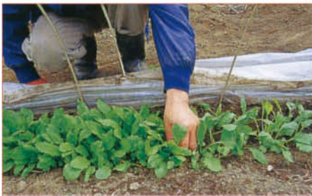
2 株と株の間隔を考えながら間引く