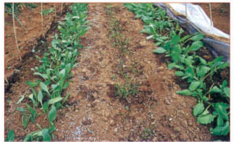
4 間引きしたあと、追肥をする

畑にじかに種をまいた野菜や、苗づくりで育苗箱にすじまきにした場合は、かなり厚まきになっているので、普通に発芽した場合には相当密生状態になっています。小さいうちは密生しているほうが共育ち(共存)の現象でお互いにかばい合ってよく育ちます。1本立てで孤立しては環境条件の影響をまともにうけ、ストレスが多くよく育ちません。