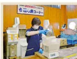
その場でお好みの精米方法を選べます