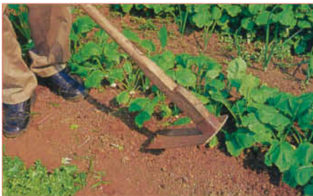
4 間引き後に追肥をし、かるく株元に土を寄せる