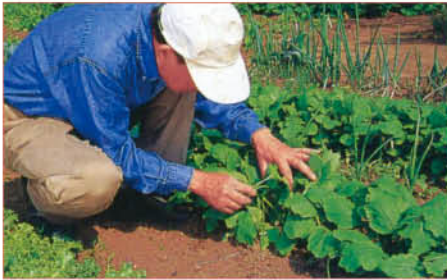
1 カブの場合、密集しているところを間引いていく