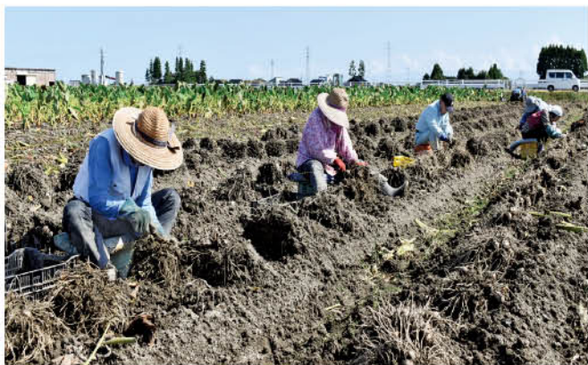
海藻肥料を使ったアルギット里芋の収穫作業

実りの秋を迎え、JA高岡管内では10月1日(日)からアルギット里芋の収穫が始まり、15日(日)に最盛期を迎えました。