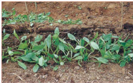
3 きれいに間引かれると、日当たりや通気がよくなり、養分を奪い合うこともない