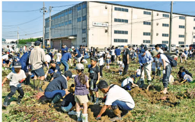
200人を超える親子でにぎわう北島地区の圃場

地域の子もたちを対象とした、青年部西部支部の食農伝承運動「西部ダッシュ村」のサツマイモ収穫体験が9月17日(日)青年部が管理する北島地区の圃場で行なわれました。