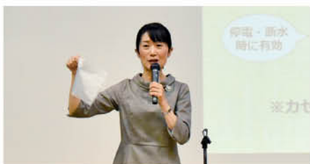
実演を交えた講演会 あっという間の90分

10月7日(土)午後1時30分より高岡JA会館7階大ホールで、家の光愛読者のつどいが開催され、120名あまりの愛読者が参加しました。