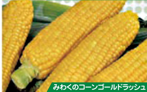
みわくのコーンゴールドラッシュ