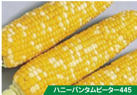
ハニーバンタムピーター445