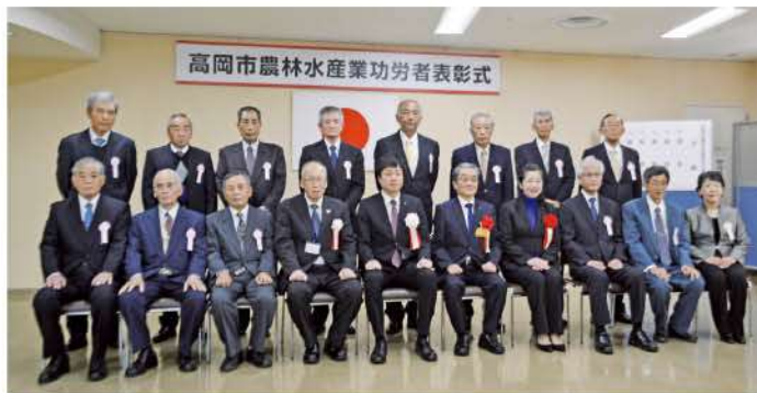
受賞者のみなさま

これは、高岡市農林水産業の振興に功労のあった者を表彰し、農林水産業者の技術向上と経営安定の高揚に資することを目的に高岡市が毎年行なっているものです。