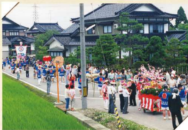
集落の住民みなでお祝い