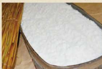
ふわふわに発酵させた米麴が甘さの秘訣

■特選こうじ味噌……「手づくり味噌」よりもさらにたっぷり麴が入った味噌 [800g 1,063円(税込)]