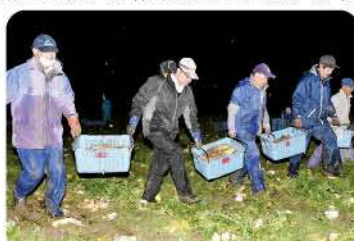
暗闇の中でも息もピッタリの「木津だいこんトレイン」

12月2日(土)の収穫作業には盟友ら14人が集まり、圃場から車に大根を運ぶ作業では、盟友が横一列になって大根の入ったコンテナを運ぶ恒例の「木津だいこんトレイン」がお目見えし、暗闇の中でも息もピッタリで共同作業を行ないました。