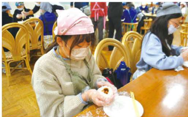
具を入れてまんまるに握っていきます

11月17日(金)午前9時より西条小学校ランチルームで開催された米ニューケーション田交流会で、5年生と青年部・女性部でおにぎりを握りました。