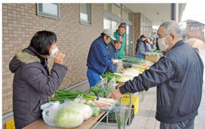
新鮮な冬野菜がずらり

12月15日(金)農産物直売所めぐりっちの出張販売が西部支店前で開催され、ダイコンやネギ、ハクサイ、カブなどの高岡産の新鮮な冬野菜を求めて多くの地域住民でにぎわいました。