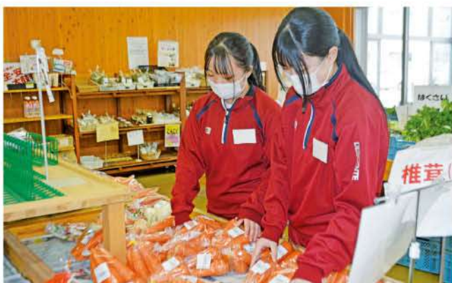
商品棚を整頓する生徒たち

12月5日(火)から7日(木)にかけて、授業で学習した内容を実社会で実践し、勤労観の育成やコミュニケーション能力の向上を図るため、高岡商業高校1年生4人が農産物直売所めぐりっち佐野店でインターンシップを行ないました。4人はレジ業務や商品陳列棚整頓など、店内で意欲的に業務に取り組んでいました。