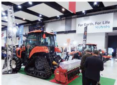
注目が集まる大型機械

富山県JAグループが主催する「アグリチャレンジ2023」が12月8日(金)・9日(土)富山産業展示館テクノホールで開催されました。