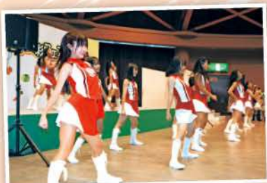
富山ブラウジーズ専属ダンスチーム G.O.W