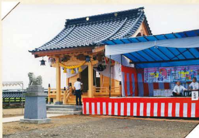
完成した徳市神明社

やらの吊りするために他の集落の方に連日わざわざ来ていただいて、集落のみんなで夜通し練習したり、集落内の母親と子どもたちが集まって宝船の絵を描いたり、何もないところから集落の住民総出で神事を行ないました。老若男女問わず地域みんなで成し遂げることができた団結力を今も誇りに思います。