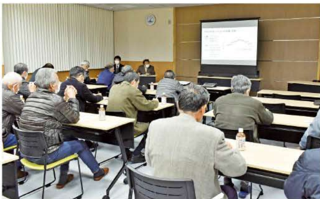
図表や写真を多く用いた動画による説明

12月11日(月)から12月15日(金)にかけて、令和5年度支店別営農研修会が支店・地区センター単位(8会場)で開催され、水稻生産者や生産組織の関係者が出席しました。