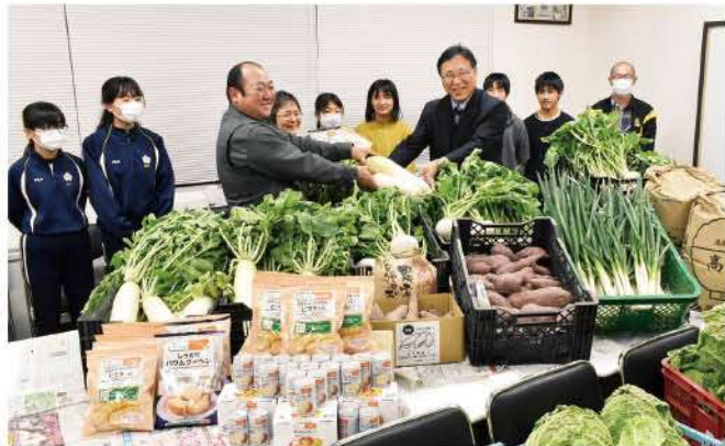
贈呈品を手渡す橘青年部長と福井女性部長

青年部の「実りの秋贈呈運動」が12月8日(金)高岡愛育園で行なわれ、青年部役員3名と女性部長が参加して、子どもたちに高岡産の安心・安全・新鮮な農産物を贈呈しました。