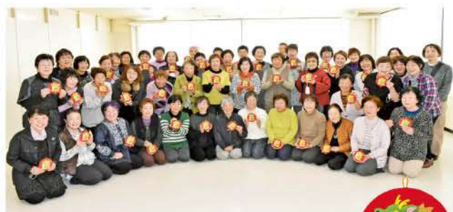
久しぶりの集合写真 みなさんの笑顔が輝いています

参加者は「なかなか会う機会もなく久しぶりにみなさんと会えてうれしい」「次は巳年。どんなデザインの押し絵になるか、今から楽しみ」と話していました。