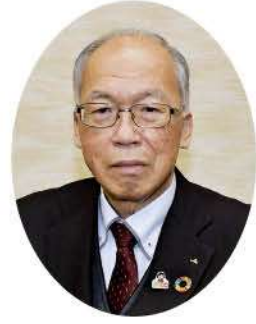
高岡市農業協同組合 代表理事組合長