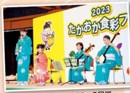
大石四世代ファミリーの民謡