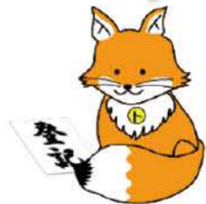
不動産登記推進イメージキャラクター 「ウッキツネ」

※ 相続登記の申請手続は法務局で。ご不明な点は、末尾の「お問合せ先」にお尋ねください。