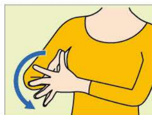
(4) (1)の状態から手首を外向きに倒し、親指が上を向く状態にします。そのまま手首を手前に倒し、小指が上を向く状態にします。10回ほど繰り返します。余裕があれば、指先に力を入れて反らしてみましょ。