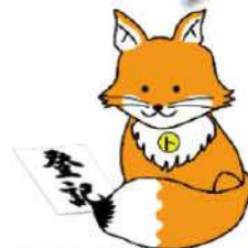
不動産登記推進イメージキャラクター 「ウキツネ」

※ 相続登記の申請手続は法務局で。ご不明な点は、末尾の「お問合せ先」にお尋ねください。