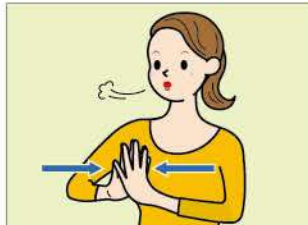
(2) 両手指にぐっと力を入れ、指先から指の付け根までくっつけたまま反らします。このとき、10秒ほどかけて息を吐きながら行います。