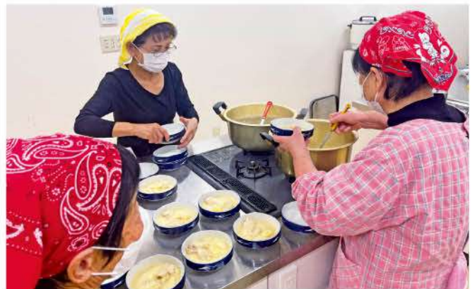
アツアツ豆乳煮を盛り付け

12月20日(水)西部支店2階調理室で『家の光』記事活用料理教室を開催しました。「こんにゃくのドライカレー」「鶏肉とジャガイモの豆乳煮」「ミルクもち」の3品を手際よく一時間あまりで調理しました。