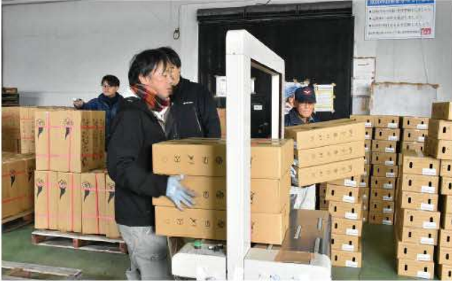
出荷先ごとに梱包作業をおこなう部会のメンバー

12月初旬から始まった高岡産チューリップ切り花の出荷が最盛期を迎え、1月15日(月)高岡市切花生産部会の生産者は丹精込めて育てた切り花を是戸地区センターに持ち寄り、東京や大阪、北海道、福岡などへ出荷しました。