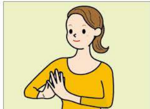
(1) 両手の指の間を開いた状態で、指先同士を軽く付けます。