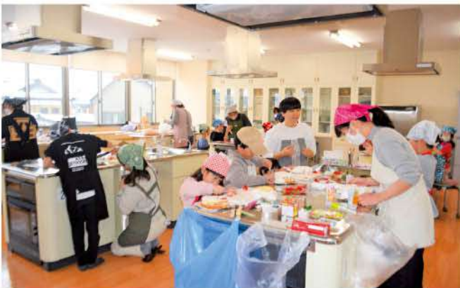
クリスマスケーキ作りを楽しむ部員

J A高岡フレッシュミセスは、高岡市内の親子が楽しみながら「食」と「農」について学び、交流することを目的に「わくわくキッズひろば」を開催しています。12月24日(日)戸出コミュニティセンターで約20名の親子が参加してクリスマスケーキを作りました。