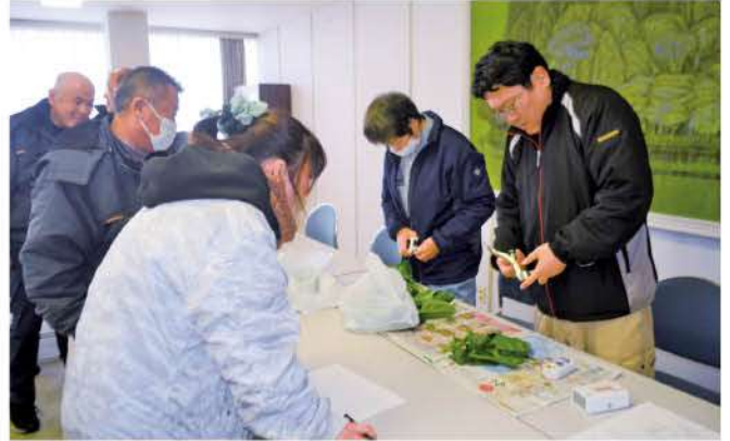
ほうれんそうの草丈や糖度を測定

12月22日(金)高岡市農協野菜出荷組合軟弱部会の部会員が集まり、寒締めほうれんそう目揃え会が開催され、県農林振興センター職員と営農指導員がほうれんそうの草丈や糖度を測定し、出荷時期について話し合いました。