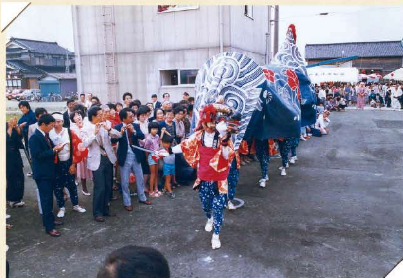
勇壮な獅子舞に見入るたくさんの住民たち